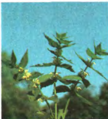
602. Глуха кропива біла.